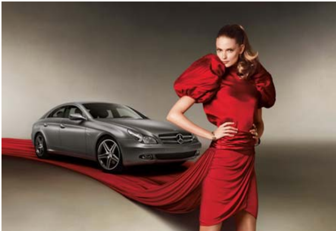
Das internationale Top-Model Julia Stegner und der Mercedes-Benz CLS 350 CGI Grand Edition sind die Hauptdarsteller des Bildmotivs der Mercedes-Benz Fashion Week Herbst / Winter 2009 in Berlin.

„Die Idee war, die Situation am roten Teppich bei den Mercedes-Benz Fashion Weeks widerzuspiegeln und so die enge Beziehung zwischen Mode und der Eleganz des Fahrzeugs aufzugreifen“, erklärt Michelangelo di Battista. Die Gestaltung des Bildmotivs basiert auf der Verbindung von