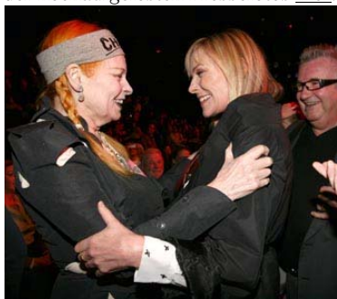
Vivienne Westwood und Kim Cattrall begrüßen sich auf der Mercedes-Benz Fashion Week Berlin