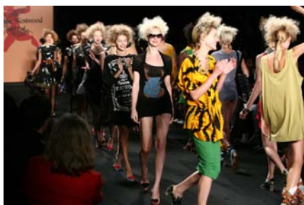
Impression aus der Show von Vivienne Westwood Download Pressefotos hier .