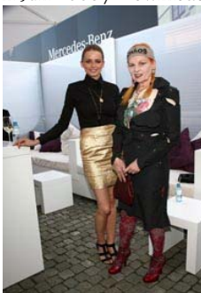
Eva Padberg und Vivienne Westwood in der Mercedes-Benz Lounge